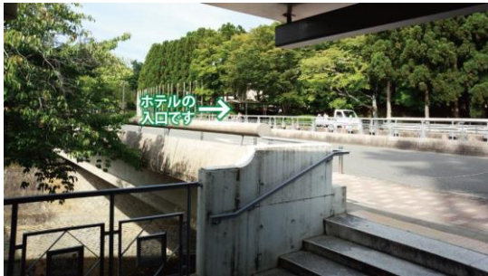
⑥從出口對面的酒店入口進去